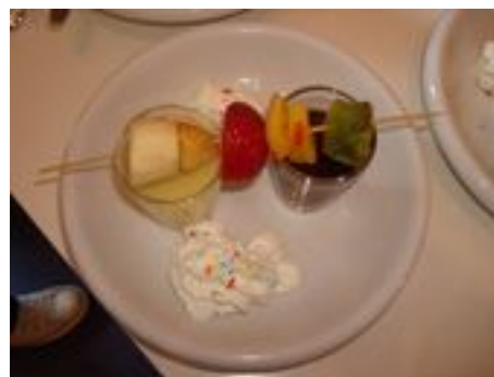
le duo de chocolat aux fruits