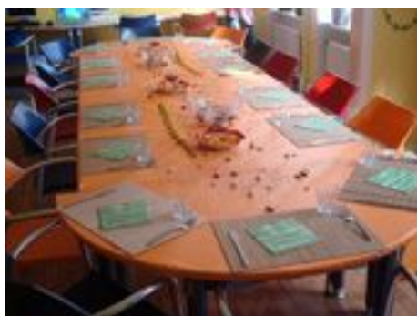
La table décorée

Pour la suite, des tagliatelles aux fruits de mer ont été servies. Pour terminer cet agréable moment autour de la table, le troisième vœu était un duo de chocolat avec une brochette de fruits.